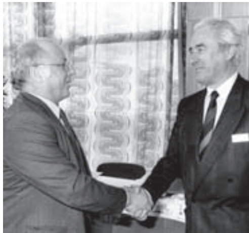
Norbert Blüm und Kasten Vilmar bei der 21. Sitzung der Konzierten Aktion im Gesundheitswesen in Bonn.

Unter dem Beifall von 5.000 demonstrierenden Medizinstudenten in Bonn verlangt der Marburger Bund eine verstärkte Aufsicht über das Geschäftsgebaren des Institutes für medizinische und pharmazeutische Prüfungsfragen (IMPP) . Hintergrund ist die Verschärfung der ärztlichen Vorprüfung.