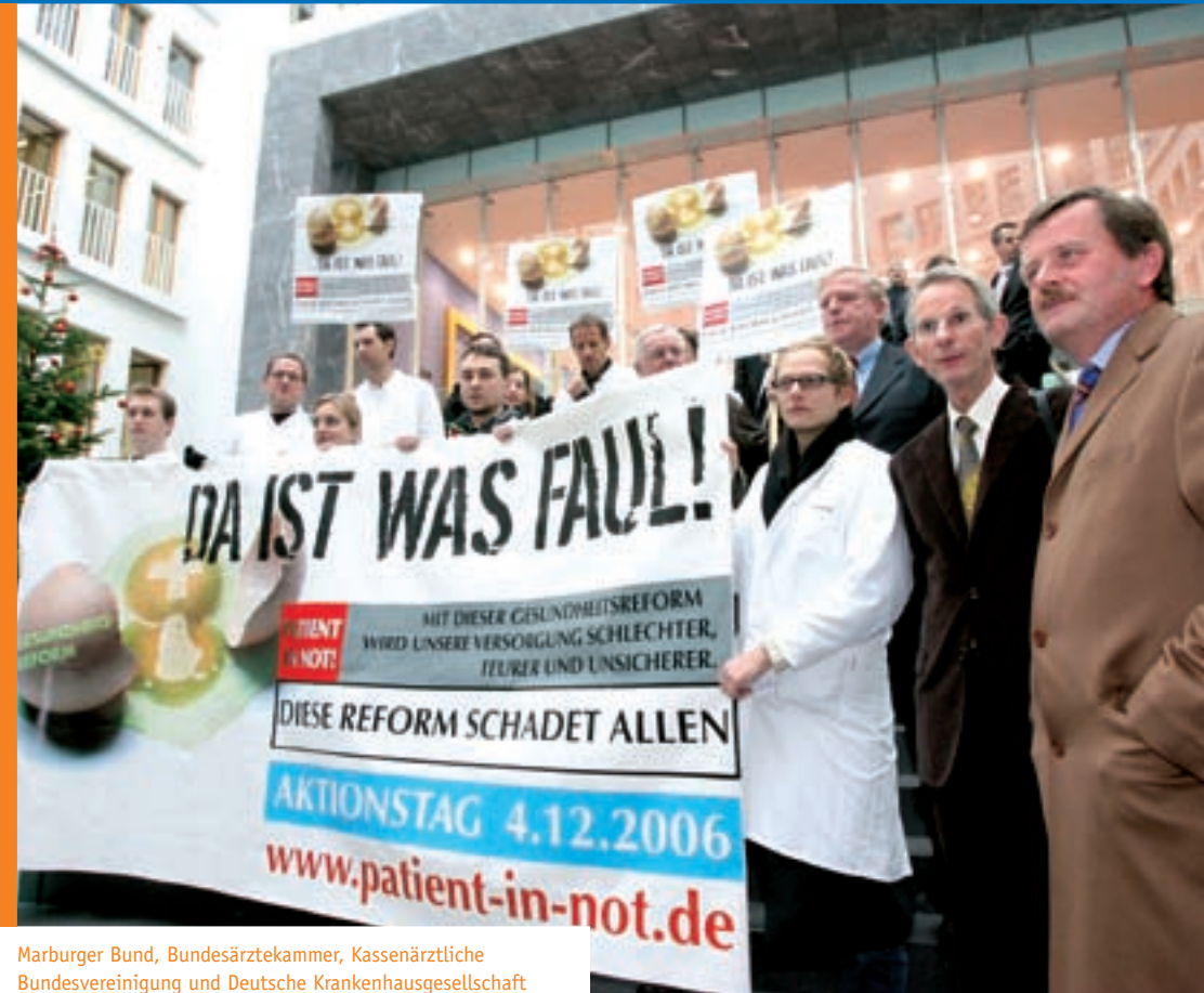
Marburger Bund, Bundesärztekammer, Kassenärztliche Bundesvereinigung und Deutsche Krankenhausgesellschaft protestieren gegen die Gesundheitsreform.