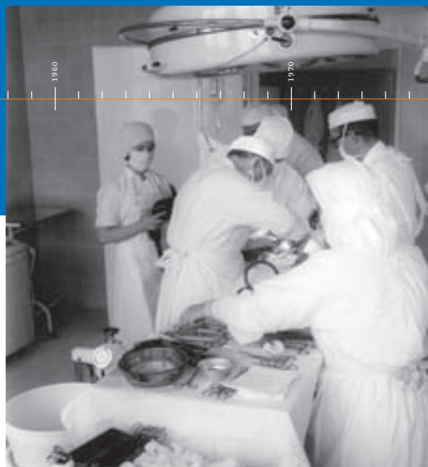
Operationssaal in den 50er Jahren.