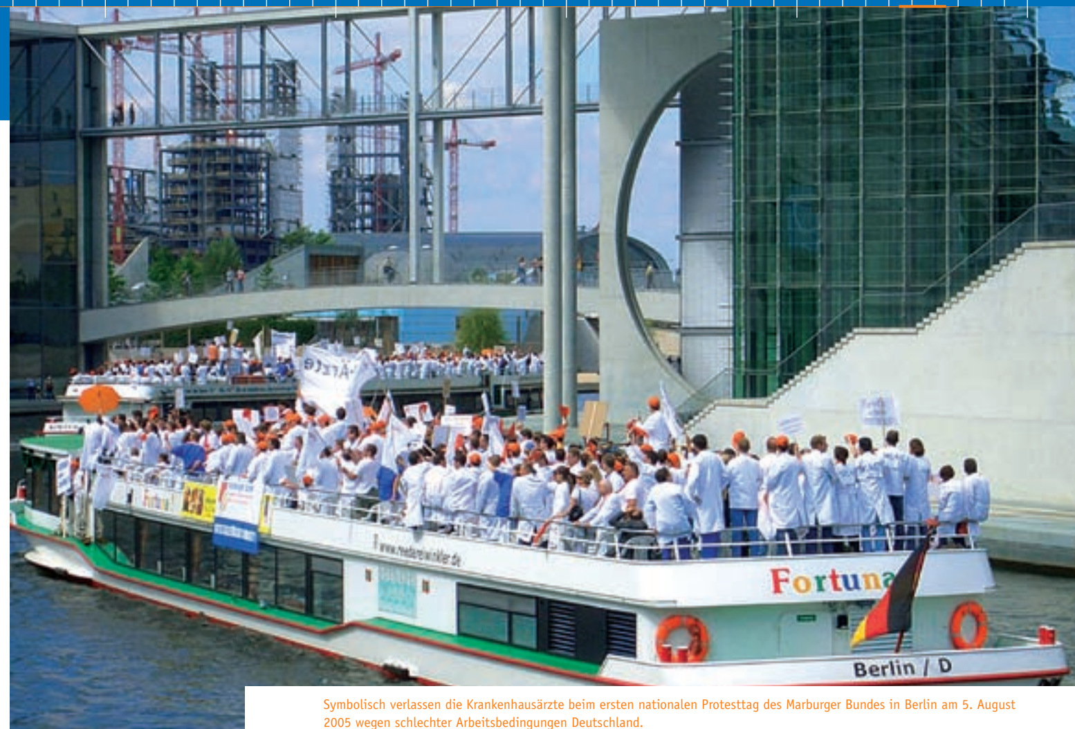
Symbolisch verlassen die Krankenhausärzte beim ersten nationalen Protesttag des Marburger Bundes in Berlin am 5. August 2005 wegen schlechter Arbeitsbedingungen Deutschland.

Ärzte der Universitätskliniken Gießen, Marburg, Heidelberg, Würzburg, Hamburg, Hannover, Mannheim, Berlin, Köln und Aachen folgen einem Aufruf des Marburger Bundes und demonstrieren gegen die von bestimmten Bundesländern vollzogene Erhöhung der Wochenarbeitszeit ohne Lohnausgleich und die Kürzungen beim Weihnachts- und Urlaubsgeld. Unterdessen verstärkt sich die Kritik am geplanten Tarifvertrag für den öffentlichen Dienst.