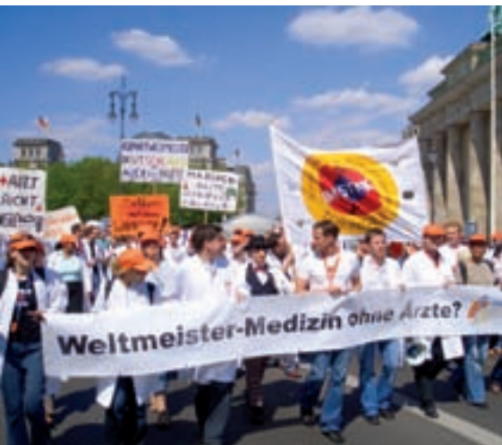
4.000 Universitätsärzte aus ganz Deutschland demonstrieren beim bundesweiten Protesttag am 3. Mai 2006 in Berlin für einen eigenen Tarifvertrag.

Marburger Bund und VKA unternehmen einen weiteren Einigungsversuch . Begleitet wird die Verhandlungsrunde am 14. August von den bisher massivsten Ärztestreiks in kommunalen Kliniken. Insgesamt legen bundesweit 17.300 Mediziner in 185 Krankenhäusern ihre