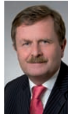
Dr. med. Frank Ulrich Montgomery