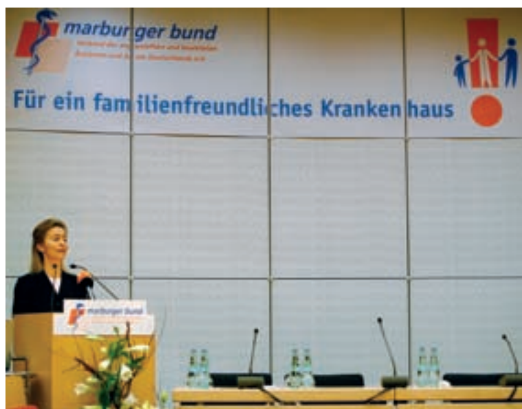
Als Schirmherrin gibt Bundesfamilienministerin Ursula von der Leyen den Startschuss zur Marburger-Bund-Kampagne „Für ein familienfreundliches Krankenhaus!“.

Ein familienfreundliches Krankenhaus ist ein Gewinn für alle – sowohl für den Arbeitgeber als auch das Klinikpersonal und die Patienten.