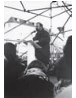
Marburger-Bund-Vize Rudolf Henke spricht auf einer Medizinstudenten-Demo in Bonn gegen die Gesundheitsreform.

Während dieser Frist bis September 1993 entschließen sich 10.500 Ärzte zur Niederlassung als Kassenarzt. Folge: In den Kliniken kommt es aufgrund des massenhaften Exodus erfahrener Krankenhausärzte zu Personalengpässen.