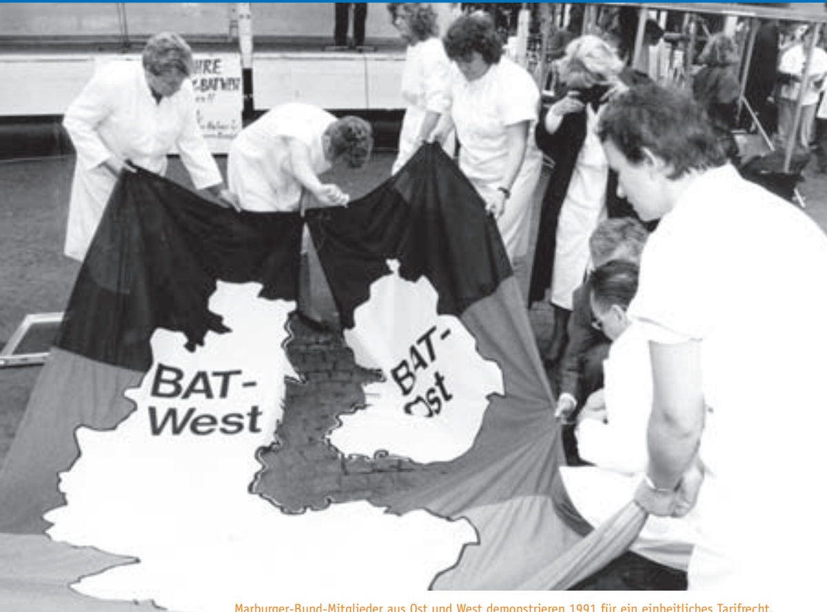
Marburger-Bund-Mitglieder aus Ost und West demonstrieren 1991 für ein einheitliches Tarifrecht.