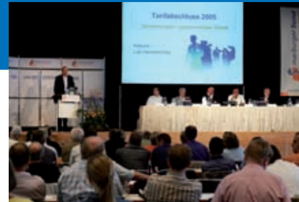
Die 108. Marburger-Bund-Hauptversammlung lehnt den TVöD ab, entzieht Verdi die Verhandlungsvollmacht und fordert die Arbeitgeber zu arzt-spezifischen Tarifverhandlungen auf.

Am zweiten bundesweiten Streik- und Protesttag des Marburger Bundes am 6. September in Stuttgart gehen 5.000 Klinikärzte auf die Straße und demonstrieren gegen Lohnraub durch längere Arbeitszeiten und Kürzungen des Weihnachts- und Urlaubsgeldes.