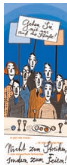
Mit einem Straßenfest wird das 60-jährige Jubiläum des Marburger Bundes gefeiert.

Sechs Jahrzehnte Verbands- und Gewerkschaftsgeschichte haben sowohl im gesundheitspolitischen als auch im tarif- und berufspolitischen Umfeld für entscheidende Veränderungen zu Gunsten der angestellten und beamteten Ärzte in Deutschland geführt.