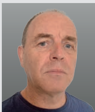
20. Arnold Wagner Urologie, Praxis, Limburgerhof