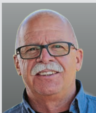
8. Michael Schaubruch Psychiatrie, Klinik, Simmern