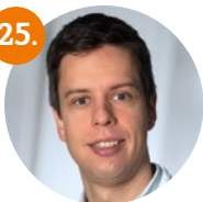
Martin Cremer Universitätsklinikum Heidelberg